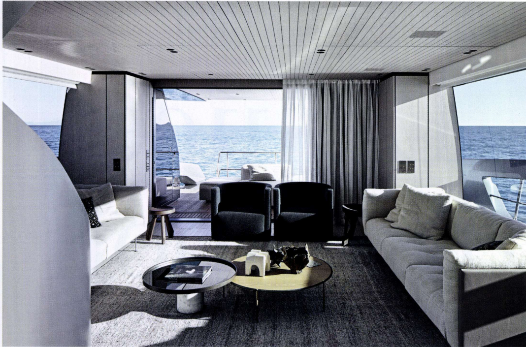
SOPRA Ancora il living. Il tappeto è di Beni Ourain Rugs. Nel pozzetto, in fondo, divano Extrasoft di Piero Lissoni (Living Divani). SOTTO, A SINISTRA La scala su disegno di Piero Lissoni. SOTTO, A DESTRA La dressing room della suite armatoriale.

immaginata a fine anni Sessanta per Flos, sembra allungare il becco per cogliere lo scatto di un pesce sott'acqua.